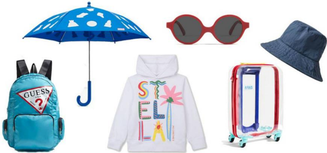
De izquierda a derecha: Guess, Hunter, Stella McCartney, Multiópticas, Zara y Cos.