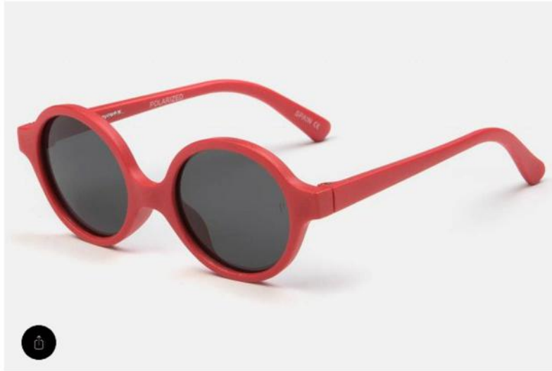
4 de 20 / Multiópticas (29€).