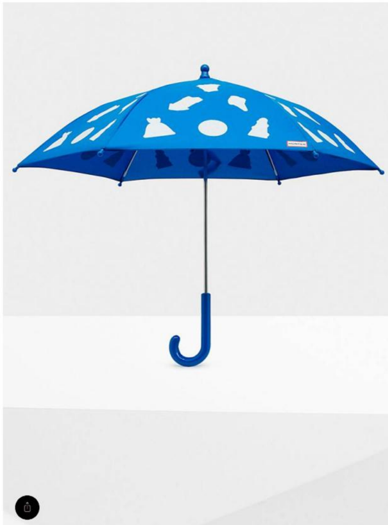
5 de 20 / Hunter (35€).